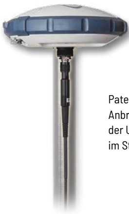
Patentierte Anbringung der UHF-Antenne im Stab