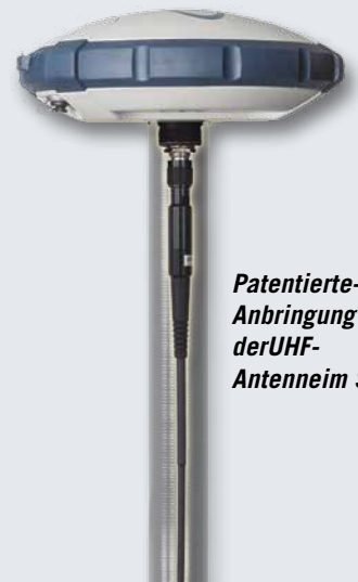
Patentiertere- Anbringung derUHF- Antenneim Stab