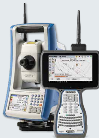
FOCUS 35 + Ranger 7

Diese Technik in Survey Pro unterstützt die Robotic-Totalstation beim Suchen nach dem Prisma, indem eine anfängliche GPS-Position übermittelt wird. Das Instrument kann sich dann mithilfe dieser GPS-Position grob auf den Prismenstab ausrichten, sodass die folgende Suche schneller erledigt ist. Diese Technik spart enorm viel Zeit und Stress auf der Baustelle.