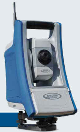
FOCUS 35 RX

Die neuen RX-Modelle der FOCUS 35 bieten eine lange Betriebszeit von 12 Stunden. Dies wird durch das System mit zwei Akkus erreicht, sodass im Laufe eines vollen Arbeitstages kein Wechsel mehr erforderlich ist.