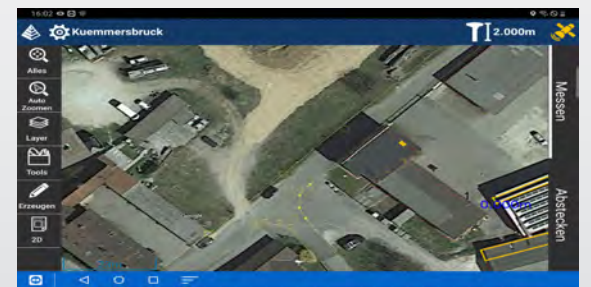
Hintergrundkarten hinzufügen - Google, OpenStreet oder WMS Dienste