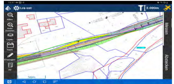
Importieren Sie CAD-Dateien im DWG oder DXF-Format

Mit Carlson Layout erhalten Sie die Vermessungssoftware, die viel bietet und trotzdem schnell und leicht erlernbar ist.