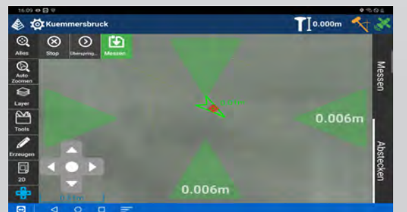
Intuitive Richtungsanzeige beim Abstecken